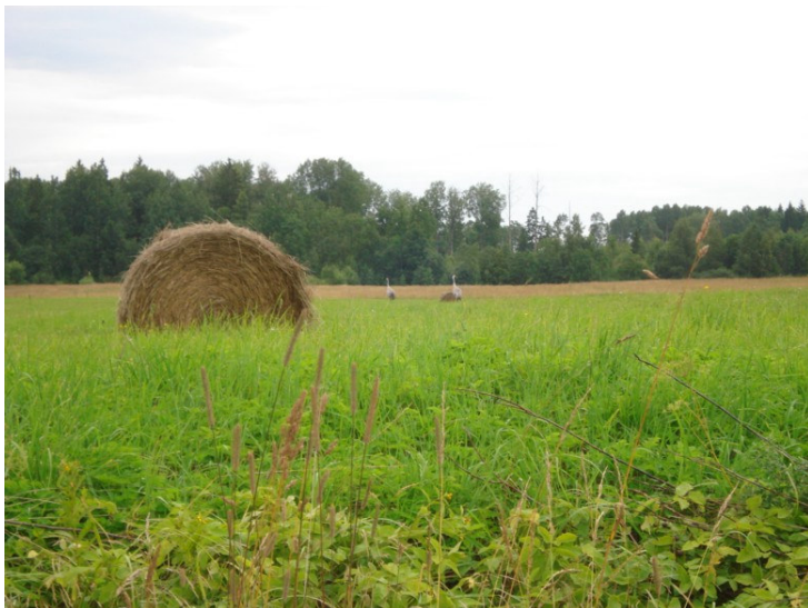
Pļavas ir nopļautas