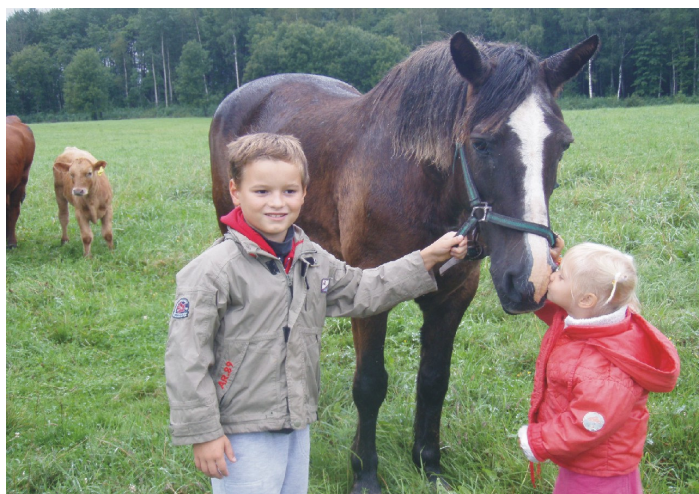
un jaunajai paaudzei te patīk.